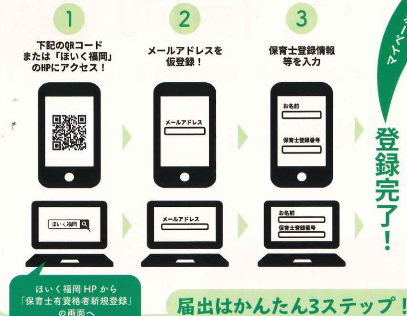
保育士資格届出サイトのマイページのイメージ

届出いただいた方には保育の最新情報や、イベント情報、復職のサポート情報を提供します。