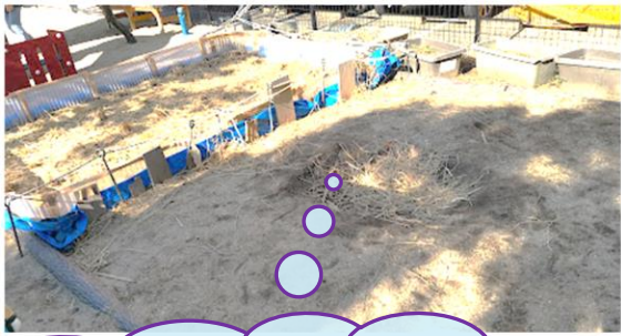
園庭の一角！ 田植え⇒稲刈り後は園児たち のあそび場として大人気！！