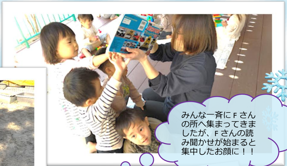
みんな一斉にFさんの 所へ集まってきま したが、Fさんの読 み聞かせが始まると 集中したお顔に！！