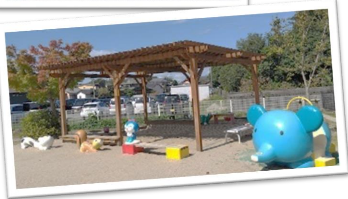
▲ 広い園庭には楽しそうな大型遊具や砂場があります♪