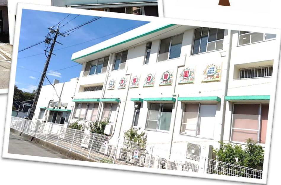
▲ 園の外観 ▶